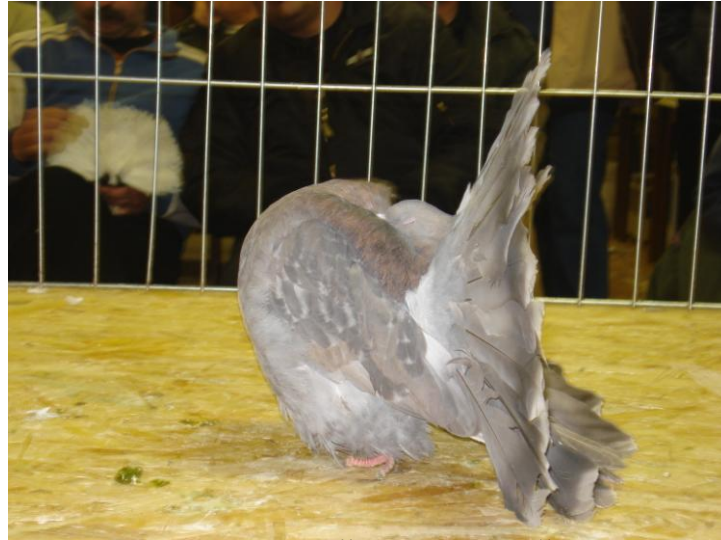
E-676/09 ŠTEF IVANEŠIĆ RESERVE