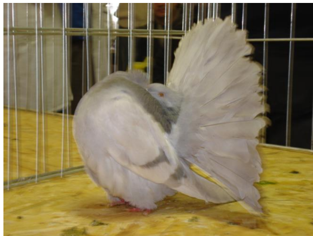
SR-112/07 BRANKO MATEŠIĆ