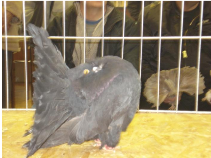
C-352/08 BRANKO MATEŠIĆ SECOND RESERVE